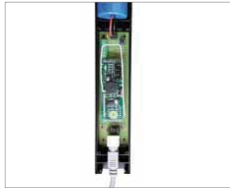
Trasmettitore radio 433 MHz integrato